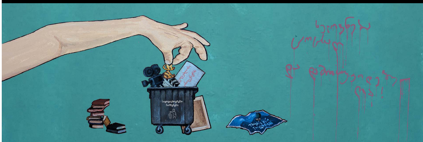
Иллюстрация: Лия Уклеба