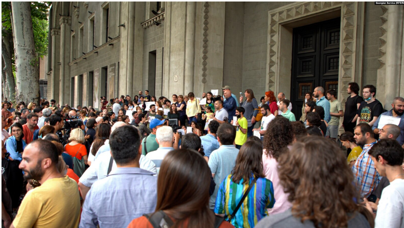
Сотрудники музея протестуют вокруг Государственного музея Грузии против действий Министерства культуры, включая массовые увольнения работников музеев и специалистов.

По данным ПРНОК, даже в тех случаях, когда гранты были восстановлены, Министерство культуры, в нарушение соглашения, достигнутого между директором Национального музея Грузии, ПРНОК и ведущими специалистами проектов, по-прежнему препятствовало проведению исследований, отказывая уволенным сотрудникам в доступе к музейным коллекциям, использовании помещений и средств на полевые работы в рамках выделенных грантов. На момент написания настоящего доклада, по информации ПРНОК, большинство исследовательских и археологических полевых проектов всё еще заморожены или отложены. Директорат либо вообще не отвечает на письма исследователей, либо отвечает с большим опозданием. Профсоюз наталкивается на ту же глухую стену 75 .