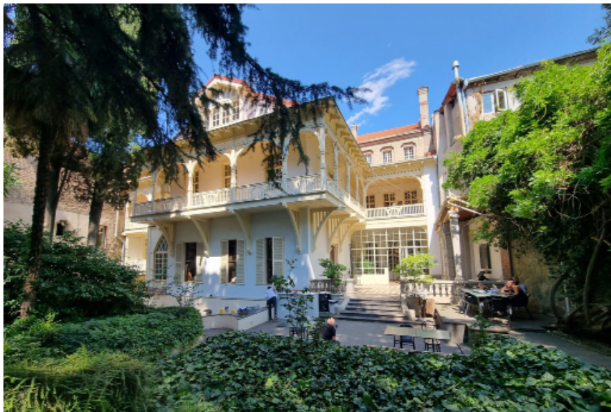
Дом писателей в Тбилиси с 2015 года является местом проведения одной из самых значимых литературных премий Грузии.

На протяжении почти всего XX века и вплоть до наших дней Государственный Дом писателей Грузии был заметным культурным учреждением для литераторов 20 и интеллигенции страны. Изначально он функционировал как советская профессиональная организация, где свои произведения могли представлять только члены Союза писателей, лояльные правительству. В 2013 году, по-прежнему получая государственное финансирование, Дом писателей распахнул свои двери для широкой публики и стал открытым для всех литераторов. Дом писателей ежегодно проводил конкурс на получение премии «Литера», учрежденной в 2015 году и являвшейся одной из главных литературных премий в Грузии.