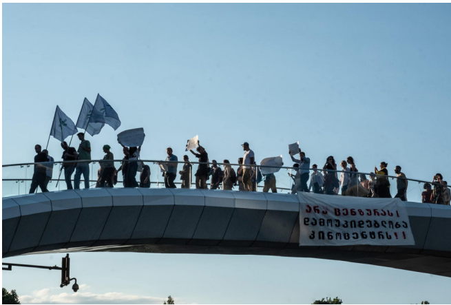
დემონსტრანტები აპროტესტებენ საქართველოს კინემატოგრაფიის ეროვნულ ცენტრში კულტურის სამინისტროს მიერ განხორციელებულ ცვლილებებს, რომლებმაც კინოცენტრის დამოუკიდებლობას საფრთხე შეუქმნა.