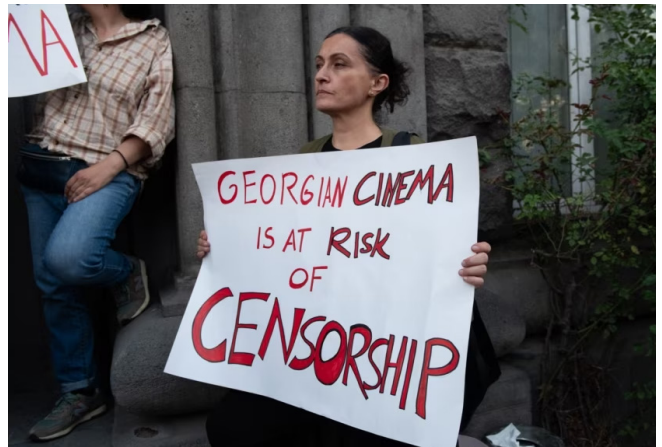
საპროტესტო აქციის მონაწილეებს უჭირავთ ტრანსპარანტი, რომელზეც წერია - „არა ცენზურას! დამოუკიდებლობა კინოცენტრს!“