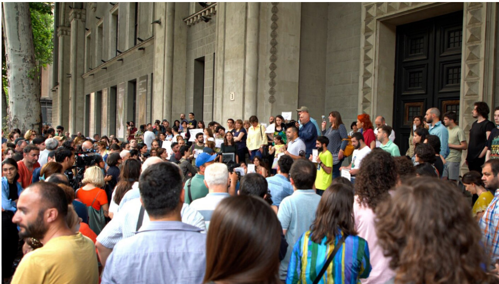
საქართველოს ეროვნული მუზეუმის წინ მუზეუმის მუშაკები აპროტესტებენ კულტურის სამინისტროს ქმედებებს, მათ შორის მუზეუმის მუშაკებისა და სპეციალისტების გათავისუფლების რამდენიმე ტალღას.

ამ დირექტორატის არსებობის პირობებში სავსებით შესაძლებელია, რომ მომდევნო პროექტებიც ასეთივე ზეწოლის და სამთავრობო კონტროლის ქვეშ აღმოჩნდეს.