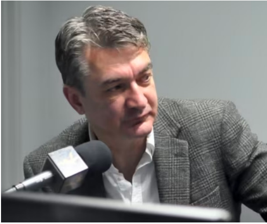
გაგა ჩხეიძე საქართველოს კინემატოგრაფიის ეროვნული ცენტრის დირექტორი 2022 წლის მარტის შუა რიცხვებამდე იყო, როდესაც ის ფეისბუქ პოსტებში საქართველოს მთავრობის გაკრიტიკების შემდეგ გაათავისუფლეს.