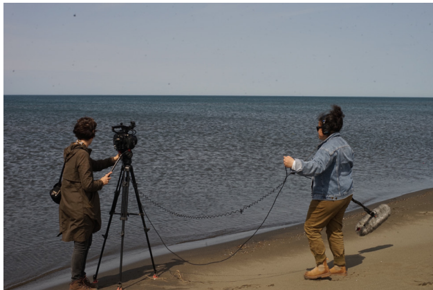
სალომე ჯაშის პრიზიორი დოკუმენტური ფილმი „მოთვინიერება“ ამ ფილმის ჩვენება საქართველოს კინოაკადემიამ გააუქმა.

საქართველოს კინემატოგრაფიის ეროვნული ცენტრის წინააღმდეგ მიმართულ ამ ქმედებებს მკაცრად გმობდნენ ცენტრის თანამშრომლები და სამოქალაქო საზოგადოება. ივნისის შუა რიცხვებში კინოცენტრის თანამშრომლებმა კიდევ ერთი წერილი გამოაქვეყნეს, რომელშიც მოითხოვდნენ რეორგანიზაციის შეწყვეტას მანამ, სანამ კინოინდუსტრიის პროფესიონალებით დაკომპლექტებული კომისია არ შეარჩევდა ახალ დირექტორს სამართლიანი, გამჭვირვალე და კონკურენტული პროცესის მეშვეობით. ამ წერილს ქართული კინოინდუსტრიის წარმომადგენლებმაც მოაწერეს ხელი. 84 კინოცენტრის დამოუკიდებლობის მხარდასაჭერად 60-მა მწერალმა სოლიდარობის წერილი გამოაქვეყნა. 85 ადამიანის უფლებათა დამცველმა უამრავმა დამოუკიდებელმა ქართულმა თუ საერთაშორისო ორგანიზაციამ ხელი მოაწერა წერილს, რომლითაც დაგმო გამოხატვის თავისუფლების შეზღუდვა საქართველოში. 86