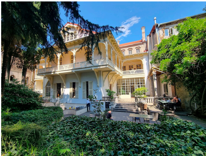
თბილისში „მწერალთა სახლი“ 2015 წლიდან მასპინძლობს საქართველოს ერთ-ერთ უმნიშვნელოვანეს ლიტერატურულ კონკურსს.

სახელმწიფო საკუთრებაში არსებული „საქართველოს მწერალთა სახლი“ მე-20 საუკუნის ადრეული პერიოდიდან მოყოლებული დღემდე კულტურის ერთ-ერთ გამორჩეულ ინსტიტუტად რჩება ქართველი მწერლებისა და ინტელექტუალებისთვის. თავდაპირველად ის საბჭოთა ტიპის დაწესებულება იყო, სადაც საკუთარი ნაწარმოებების წარდგენა მხოლოდ იმ მწერლებს შეეძლოთ, რომლებიც „მწერალთა კავშირის“ წევრები და ხელისუფლების მომხრენი იყვნენ. 2013 წელს მისი კარი უფრო ფართოდ გაიღო და ის, მართალია, სახელმწიფო დაფინანსებას ისევ იღებს, ღიაა ნებისმიერი მწერლისთვის. 20 მწერალთა სახლი ყოველწლიურად ატარებს კონკურსს „ლიტერა,“ რომელიც 2015 წელს დაარსდა და ლიტერატურის დარგში საქართველოს ერთ-ერთი ყველაზე მნიშვნელოვანი პრემიაა. 21