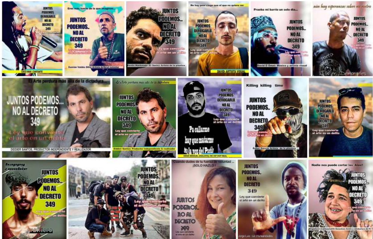
Afiches hechos para la campaña #NoAlDecreto349, 2018.

En su estado actual, el decreto va en contra del compromiso de Cuba de respetar los derechos humanos fundamentales y pone en riesgo la libertad artística.